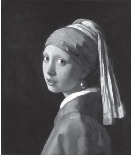
Abb. 2: Girl with a Pearl Earring von Johannes Vermeer - www.geheugenvannederland.nl : Home : Info : Pic. Lizenziert unter Gemeinfrei über Wikimedia Commons - http://commons.wikimedia.org/wiki/File:Girl_with_a_Pearl_Earring.jpg#/media/File:Girl_with_a_Pearl_Earring.jpg

Abzug aller Kosten für die Vermarktung durch Einräumung einfacher Nutzungsrechte (Personal, Software, Abrechnung, Werbung, Rechtsverfolgung, Rechtklärung und Management etc.) tatsächlich keine nennenswerten Einnahmen generiert wurden, die den Aufwand gerechtfertigt hätten.